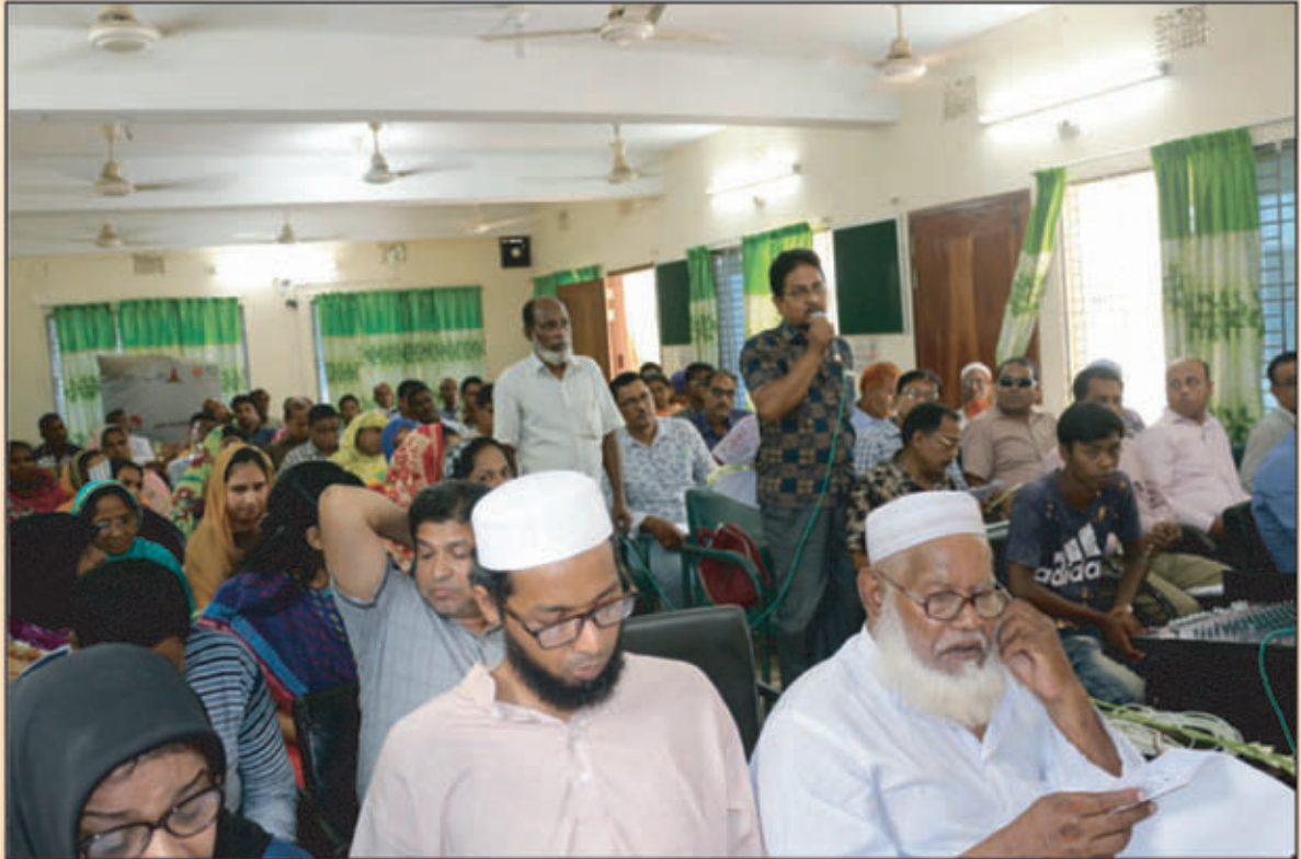
উল্লাপাড়া উপজেলা পরিষদের ২০১৮-১৯ অর্থ বছরের উন্মুক্ত বাজেট ও পরিকল্পনা সভায় উপস্থিত উপজেলা পরিষদের কর্মকর্তা-কর্মচারী, ইউপি চেয়ারম্যানবৃন্দ, ইউপি সদস্যবৃন্দ, সাংবাদিক সহ অন্যান্য ব্যক্তিবর্গ।